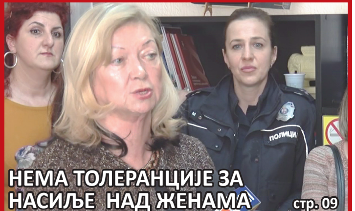
НЕМА ТОЛЕРАНЦИЈЕ ЗА НАСИЉЕ НАД ЖЕНАМА стр. 09