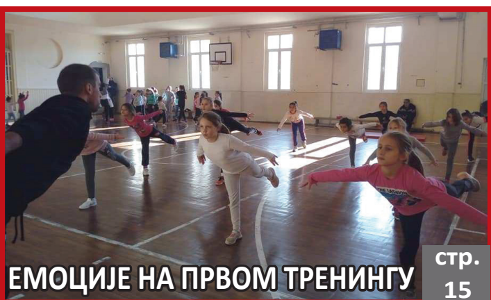
ЕМОЦИЈЕ НА ПРВОМ ТРЕНИНГУ стр. 15