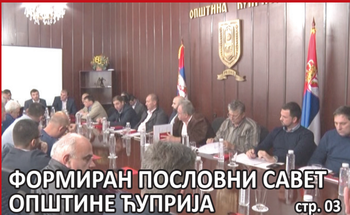
ФОРМИРАН ПОСЛОВНИ САВЕТ ОПШТИНЕ ЋУПРИЈА стр. 03