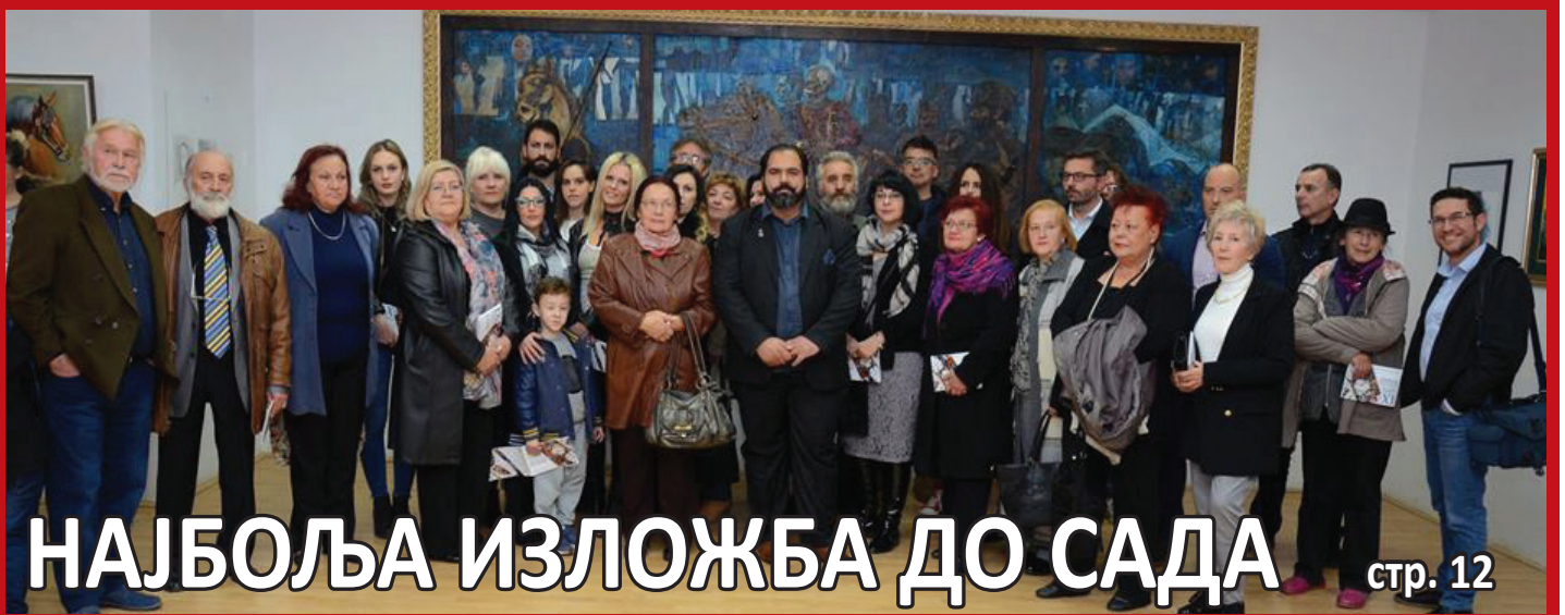
НАЈБОЉА ИЗЛОЖБА ДО САДА стр. 12

БЕЗ ПОВЕЋАЊА ПОРЕЗА НА ИМОВИНУ..... стр. 04 ЈЕСЕЊЕ АСФАТИРАЊЕ У ЋУПРИЈИ..... стр. 05 МЛАДОСТ ДОНОСИ ПОБЕДЕ..... стр. 15